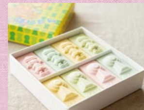
親指サイズのかわいさに、キュン。日本茶気分のときに