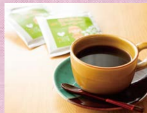
せっかくならブラジルハニーコーヒーとタンザニアキリマンジャロをブレンドした「はにたんコーヒー」(自家焙煎コーヒー マウンテン)と