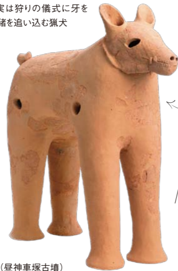
(昼神車塚古墳) ※写真は今城塚古代歴史館に展示しているもの