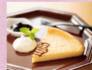
ベリー系のジャムとクリームを添えて。あたためると焼きたて感が