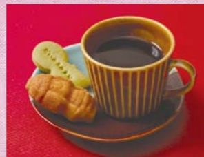
カタチがかわいいスイーツはいい感じのアクセントに