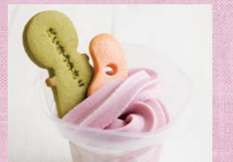
ミュージアムショップのセルフソフトクリームにオンしてオリジナルを