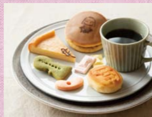
「楓っ子」「はにたんだら焼き」はコーヒーにも合うので、和洋一緒に楽しんで