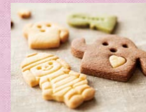
フォルムがかわいい古墳とはにわのクッキー。手作りしても楽しそう